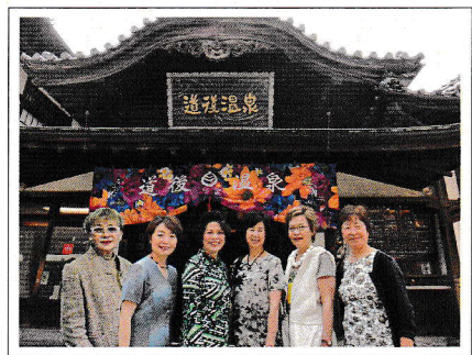
愛媛クラブ訪問にて

今期皆様はITCをどのように感じて動かれましたでしょうか。第3回会合ではITCへの思いをぶつけていただき頭の中をからっぽにして動いていただきたいと思います。きっとその次には新しい感動が待ち受けていると確信いたします。カウンスルNo.2 第34期有難うございました！